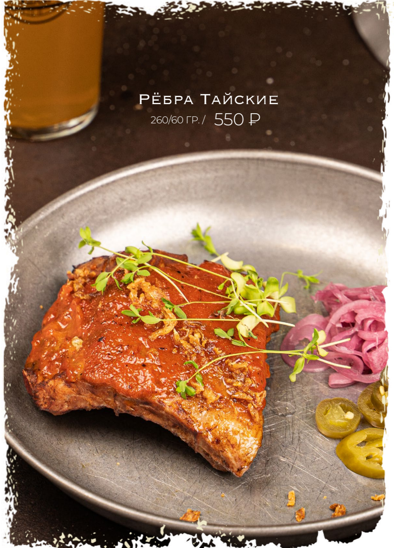
РЁБРА ТАЙСКИЕ 260/60 ГР. / 550 Р