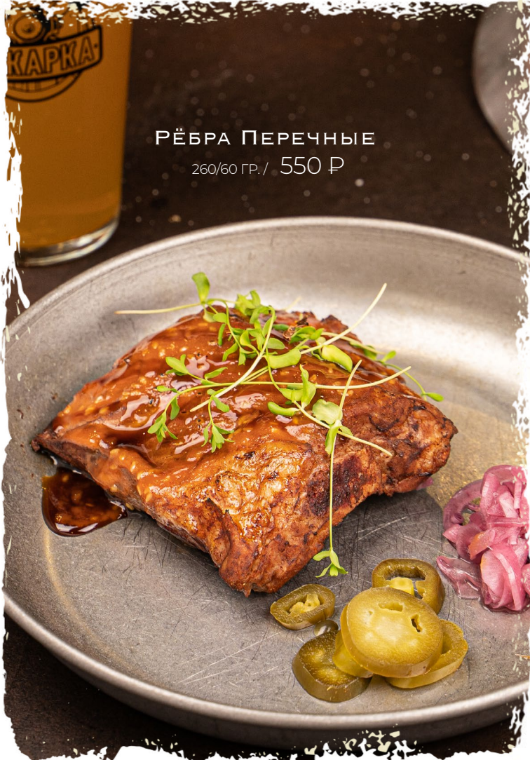
РЁБРА ПЕРЕЧНЫЕ 260/60 ГР. / 550 Р