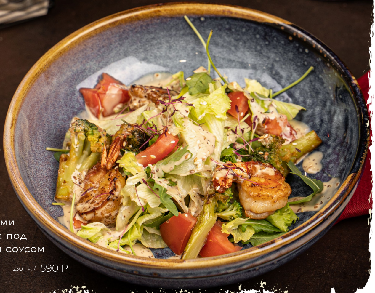
САЛАТ С КРЕВЕТКАМИ И БРОККОЛИ ПОД КУНЖУТНЫМ СОУСОМ