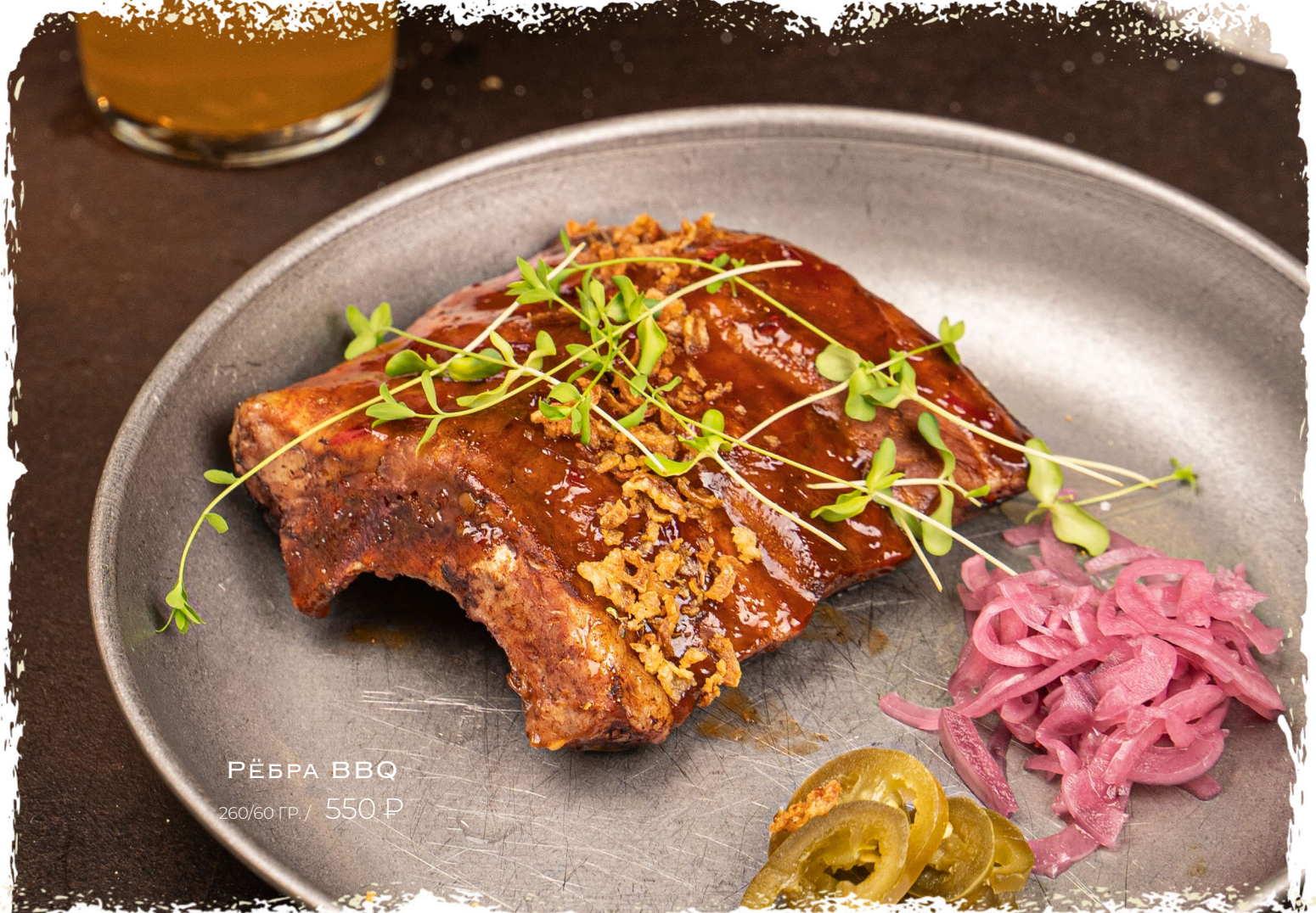
РЁБРА ВВQ 260/60 ГР. / 550 Р